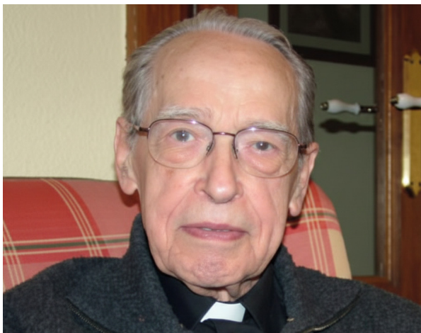
El padre, en la sala donde recibía las visitas en Toledo (1994-2011)

Hizo una breve pausa y añadió, con sencillez: “Sobre hobbies no podré ayudarte mucho, porque el único que he tenido en mi vida ha sido Jesucristo: conocer su vida, su tiempo, su lengua y su cultura, su Corazón”.